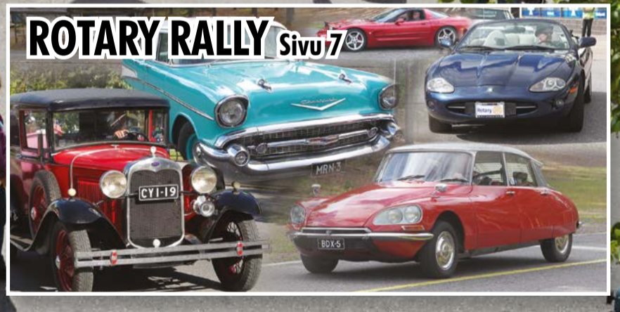
ROTARY RALLY Sivu 7