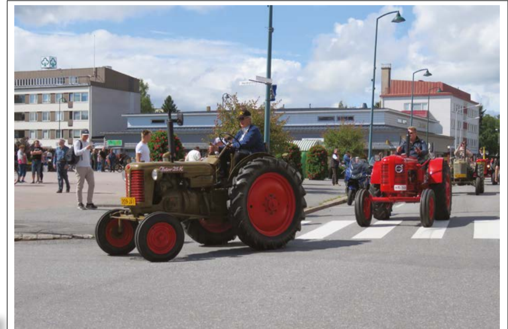
Traktorit saapuivat viime vuonna komeassa letkassa torille.