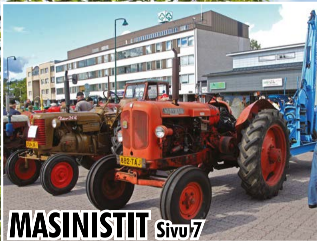
MASINISTIT Sivu 7