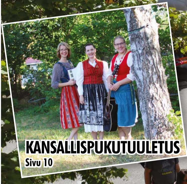
KANSALLISPUKUTUULETUS Sivu 10