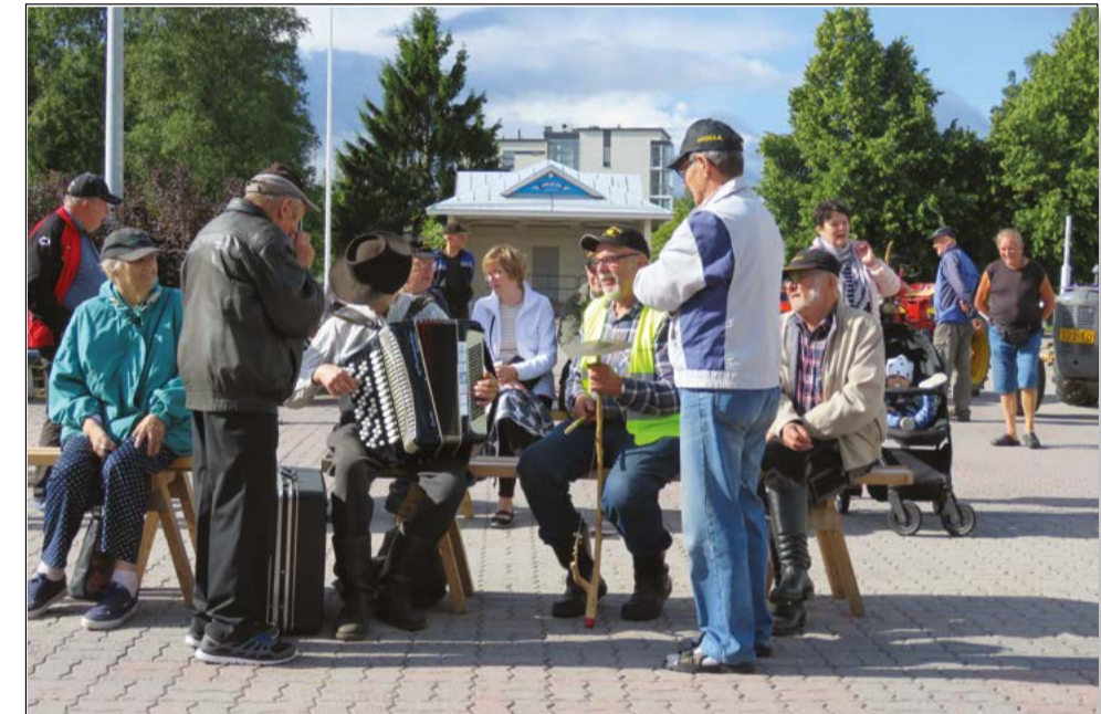
Masinistit pitävät myös musisoiden huolen siitä, että torilla riittää tunnelmaa.

Vanhat traktorit ovat torilla kello 9–14.