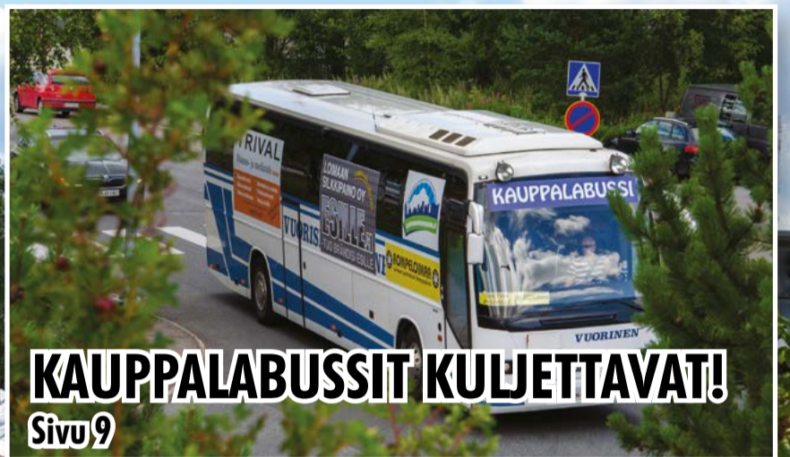
KAUPPALABUSSIT KULJETTAVAT! Sivu 9