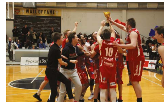
Viime kauden päätteksi Bisons juhli 1B-divisioonan mestaruutta.