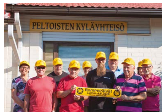
Peltoisten Kyläyhdistyksen hallitus