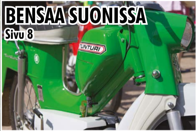
BENSAA SUONISSA Sivu 8