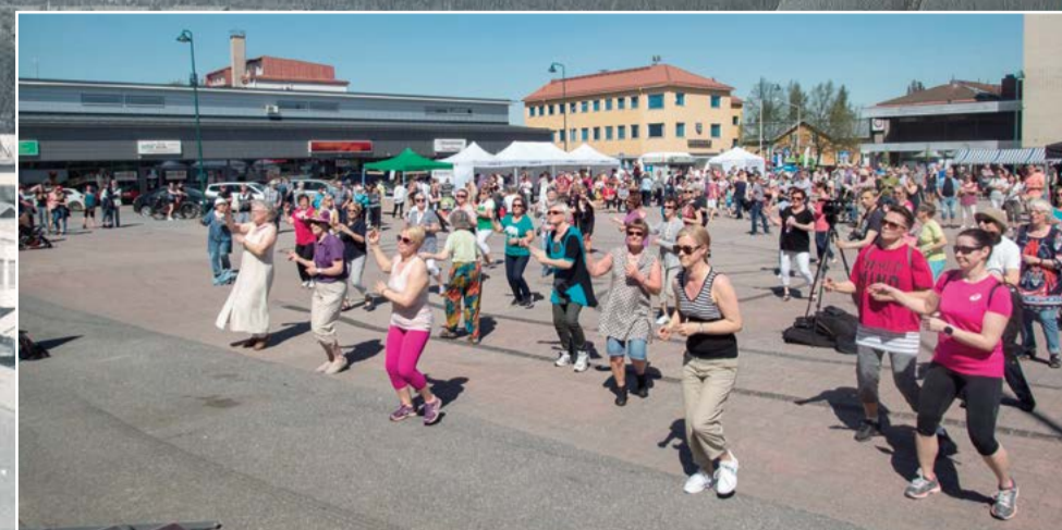
Meininkijä eli 50-vuotiaan Loimaan kaupungin juhluvuoden pääjuhlaa vietettiin toukokuussa. Väki intoutui torilla muun muassa Lavis-jumppaan.