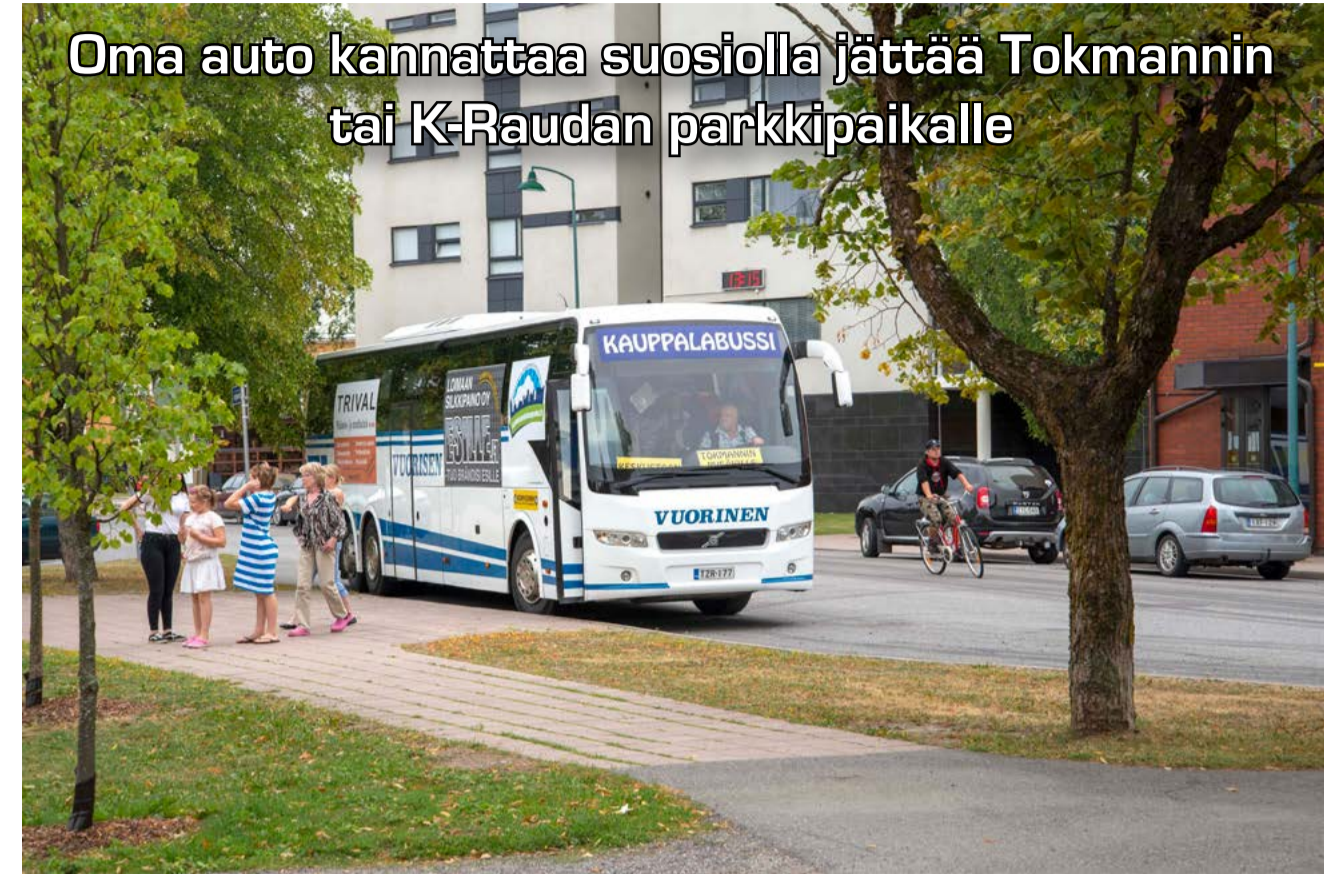
Kauppabussit liikennöivät non-stopina. Niitä voi hyödyntää kuka tahansa maksutta.

Vuorisen Liikenteen liikennöimissä ja Kauppalahdistyksen kustantamissa busseissa apuna ovat partiolaiset. Partiolaiset huolehtivat matkan turvallisuudesta ja toimivat oppaina.