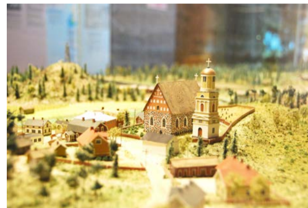
Pienoismallit kiinnostavat kaiken ikäisiä.

Vaihtuvina näyttelyinä on tällä hetkellä Matka maidon historiaan ja Anu