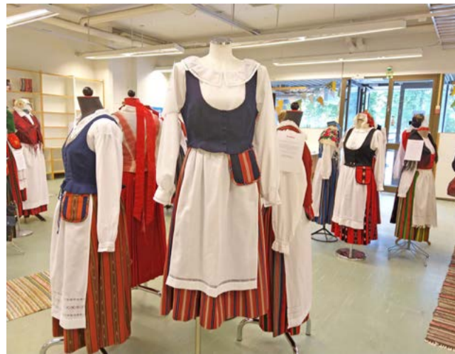
Kansallispuvu on muodikas vuodesta toiseen, ja se kestää oikein säilytettynä vuosikymmeniä. Tämän vuoden Rompeloimassa Kansallispuvutuuletusta on luvassa kello 10 alkaen.

—Moni sanoi, että omistaa kansallispuvun, muttei kehdannut laittaa sitä päälleen. Toivot-