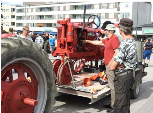
Mikäköhän tämä on? Moni entisajan laite on nykyihmiselle vieras.

Puolen päivän aikana masinistit järjestävät torilla traktorinvetokisan.